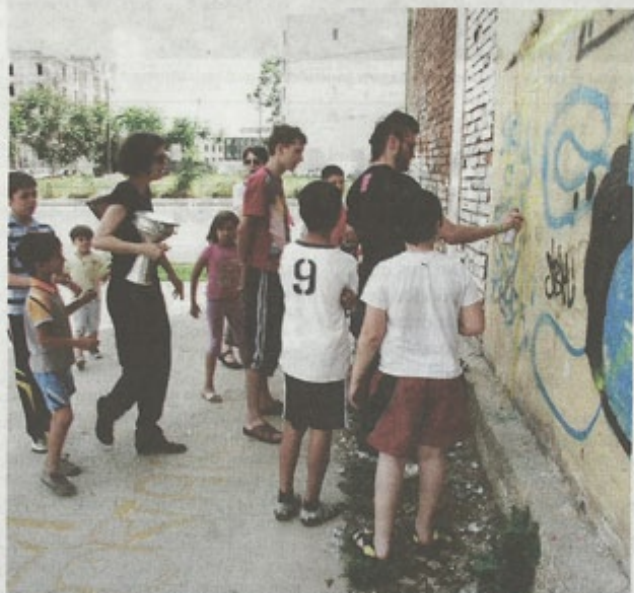
La Bomba bygger demokrati, mening och delaktighet där politiker misslyckats.

GRUPPENS dokumentär Sensitive map följer en invånare vardag, tills hans väg korsar en annans. Då byter berättandet fokus och följer istället den nya huvudpersonen, och så vidare. Ett sätt att visa