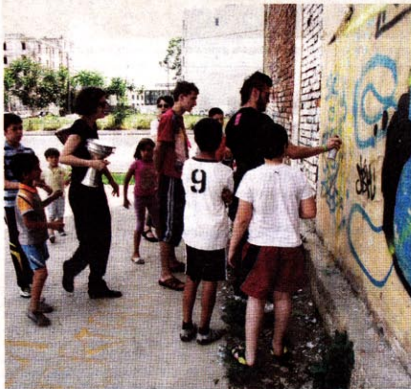
La Bomba bygger demokrati, mening och delaktighet där politikerna misslyckats.